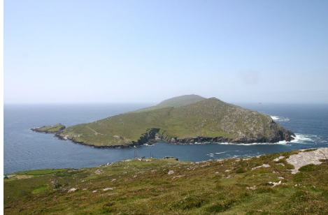
Oileán Baoi

agus bhí sé ag pócáil timpeall lena mhaide ag iompú na leac féachaint an mbeadh sé de ráth air go n-aimseodh sé é. San obair dó cad deirir ná gur iompaigh sé an leac so áirithe agus istigh fé chonaic sé an bosca óir. Bhí sé díreach ag cromadh anuas chun é d'ardú leis, nuair a thug sé súilfhéachaint éigin ar na buaibh [na ba] agus cá rabhadar ach ar bhruaich na faille agus baol go n-imeoidís síos le fána isteach sa bhfarraige. Leis sin do sháigh sé a mhaide sa talamh in aice an bhosca chun go mbeadh sé mar mharc aige, agus do chuir sé dhe síos fé dhéin na faille chun teacht roimis na ba. Do chas sé aníos arís iad, agus tháinig sé thar n-ais go dtí an áit mar ar fhág sé an bata ina sheasamh dar leis.