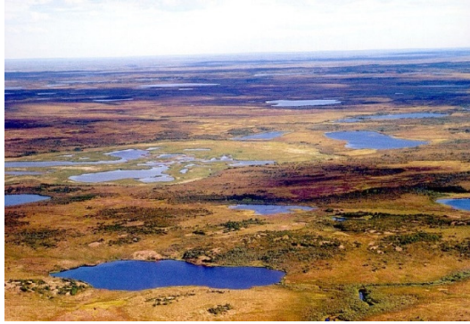
Tundra sa tSibéir