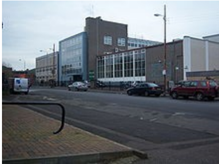
Sgoil Ghàidhlig Ghlaschu faoi spéir smúitiúil na hAlban

Tá Comhairle na nGarbhchríoch chun tosaigh maidir le hoideachas lán-Ghaeilge. Tá trí bhunscoil lán-Ghaeilge ann agus trí aonad Gaeilge ann. Tá Gaeilge á labhairt ag 52% de phobal Inse Ghall agus tá 59% de chainteoirí Gaeilge na tíre ann, ach níl aon scoileanna lán-Ghaeilge ann, cé go bhfuil oideachas Gaeilge de chineál éigin le fáil sa chuid is mó de na scoileanna. I nGlaschú atá an scoil lán-Ghaeilge is mó in Albain le fáil: Sgoil Ghàidhlig Ghlaschu agus í ag soláthar oideachas naíscóile, bunscoile agus meánscoile. Is trua, áfach, nach féidir scrúduithe a dhéanamh i nGaeilge ag an dara leibhéal ach i matamaitic, stair, tíreolaíocht agus Gaeilge. I nDún Éidean tá aon bhunscoil lán-Ghaeilge amháin.