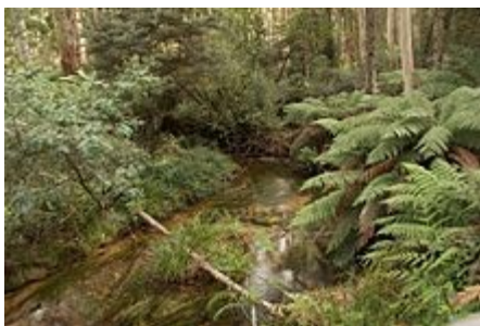
Críoch Gipps Thiar

Fuair a lán Albanach bás de ghalracha ar na longa a thug chun na hAstráile iad agus fuair siad amach nárbh fhurasta i gcónaí a mbeatha a bhaint amach sa tír nua. Dúradh ag an am nach raibh ach Gaeilge ag an gcuid is mó acu.