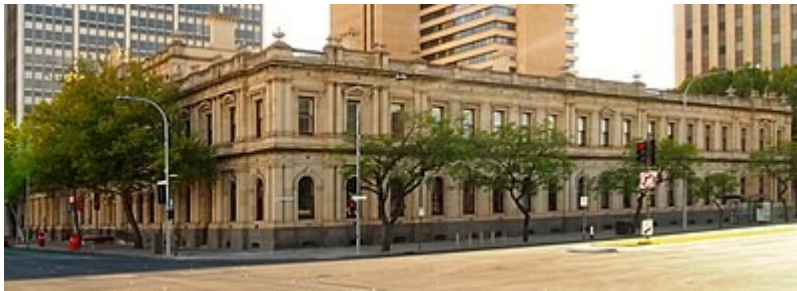
Cearnóg Victoria, Adelaide

Saor ó tháille a bheidh an chéad lá, Luan 9 Nollaig, Gaeilgeoirí ag bailiú le chéile agus buntús na Gaeilge á mhúineadh. Is gá freagra luath a thabhairt ar son lónadóireachta. Ní bhainfear ach $175 de mhic leinn agus de dhaoine neamhfhostaithe na laethanta eile. Iarrtar $100 ar lá amháin.