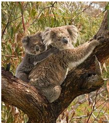
Cóála baineann agus a coileán ar a droim.

Mharaíodh na Bundúchasaigh féin cóálaí ó am go ham ach, chomh maith leis sin, ba chuid suntasach dá mbéaloideas an cóála, ainmhí críonna. Bhí na coilínigh i bhfad níos fuilítí, ach tá rudaí eile ag cur na gcóálaí i mbaol anois seachas na gunnaí agus na tinte: scriosadh a ngnáthóige, uirbiú agus triomach.