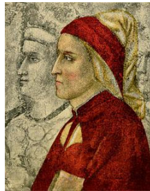
Dante Alighieri, portráid le Giotto(?) Wikimedia Commons

http://www.dantepoliglotta.it/de-brun-1963-3/?lang=en