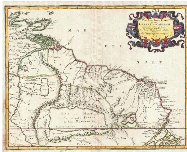
Guáin na Fraince in 1656

Sa 17ú haois tugadh sclábhaithe isteach chun barraí luachmhara a shaothrú – siúcra, spíosraí, seacláid agus caife. In 1794, le linn Réabhlóid na Fraince, chealaigh an Chomhdháil Náisiúnta i bPáras an sclábháíocht, ach d’fhill sí dá ainneoin sin agus mhair anuas go dtí 1848.