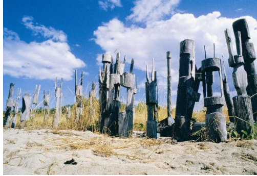
Cuailí adhlactha ar Oileáin Tiwi

Tá déantúsáin amach ó chósta thuaidh na hAstráile a bhfuil an chuid is sine de stair na mBundúchasach ag baint leo. Tá a fhios againn anois ó na hiarsmaí is sine a aimsíodh in Kakadu i gCríoch an Tuaiscirt go bhfuil daoine ina gcónaí san Astráil le 65,000 bliain ar a laghad – an daonra is buaine in aon áit lasmuigh den Afraic féin.