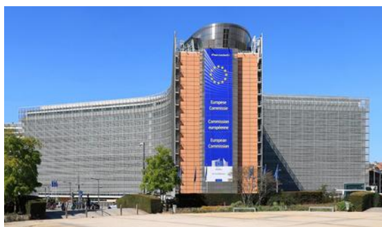
Foirgneamh Berlaymont, láithreán an Choimisiúin Eorpaigh sa Bhruiséil Wikimedia Commons

Ní líonmhar iad na feisirí Éireannacha sa Pharlaimint Eorpach a bhfuil Gaeilge acu, ach tá suaitheantas cultúrtha déanta den teanga thall agus aistritheoirí agus ateangairí á soláthar dá bharr. Ach ní hé sin amháin atá i gceist. Mar a deir tuarascáil de chuid an Aontais Eorpaigh, déanann úsáid na Gaeilge in AE ‘éiceachóras’ na teanga a shaibhriú. Maítear go raibh aird ag institiúidí an Aontais Eorpaigh ar a raibh á ndéanamh ag rialtas na hÉireann de réir Straitéis 20 Bliain don Ghaeilge 2010–2030 (straitéis nár tháinig toradh mór uirthi fós). Dá bhrí sin rinne siad iarrachtaí chun acmhainní Gaeilge a threisiú agus breis cáipéisí a sholáthar. Tá an-bhaint ag an gCoimisiún Eorpach leis seo, ós é an Coimisiún atá freagrach as beartais AE agus as iad a chur i bhfeidhm. Agus dá chastacht iad na cáipéisí céanna (nó dá leimhe), cuireann siad le réimse na Gaeilge.