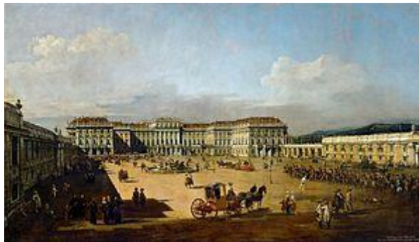
Schönbrunn (pictiúr le Bernardo Bellotto, 1758, cúpla bliain sular rugadh Kelly).

D'fhoilsigh Michael Kelly cuntas an-bhríomhar ar a shaol mar amhránaí ina lán tíortha, cé go maítear nach cuntas iontaofa i gcónaí é. Mar sin féin, foinse tábhachtach é agus é an-soléite: tugann an-údar léargas dúinn ar shaol atá imithe agus na pearsana ag éirí aníos chugainn lena gcuid gothaí, grinn agus aisteachais. Ní mór na Reminiscences a léamh más áil leat blas na linne úd a thabhairt leat.