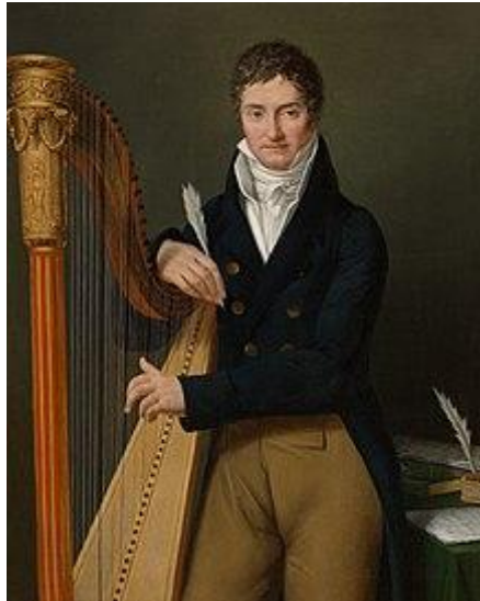
Michael Kelly (portráid le Adèle Romany, idir 1802 agus 1814).