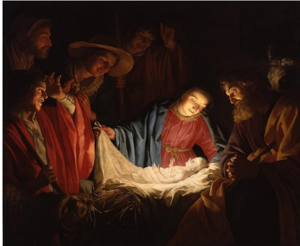
Adhradh na nAoirí, Gerrit van Honthorst (1592-1656)

Faoin 13ú haois b'fhéile mhór í an Nollaig agus í á cheiliúradh ag íseal agus ag uasal araon.