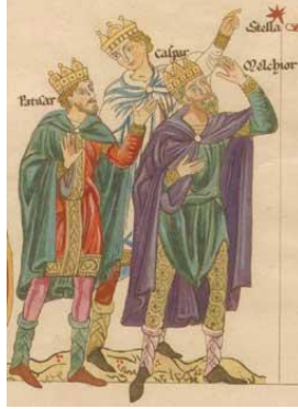
An Triúr Draoithe in Hortus Deliciarum, Herrad ó Landsberg, 12ú haois.

Seo thíos scéal na ndraoithe as An Bíobla Naomhtha , an leagan den Bhíobla is sine i nGaeilge. Foilsíodh an Tiomna Nua in 1602 agus an Sean-Tiomna in 1685, agus cuireadh iad i gcló le chéile in 1690. Cuireadh eagrán nua amach in 1817, agus is iomaí teaghlach Caitliceach a raibh sé curtha i dtaisce acu, cé go raibh amhras ag an Eaglais air mar fhoilseachán 'Protastúnach'.